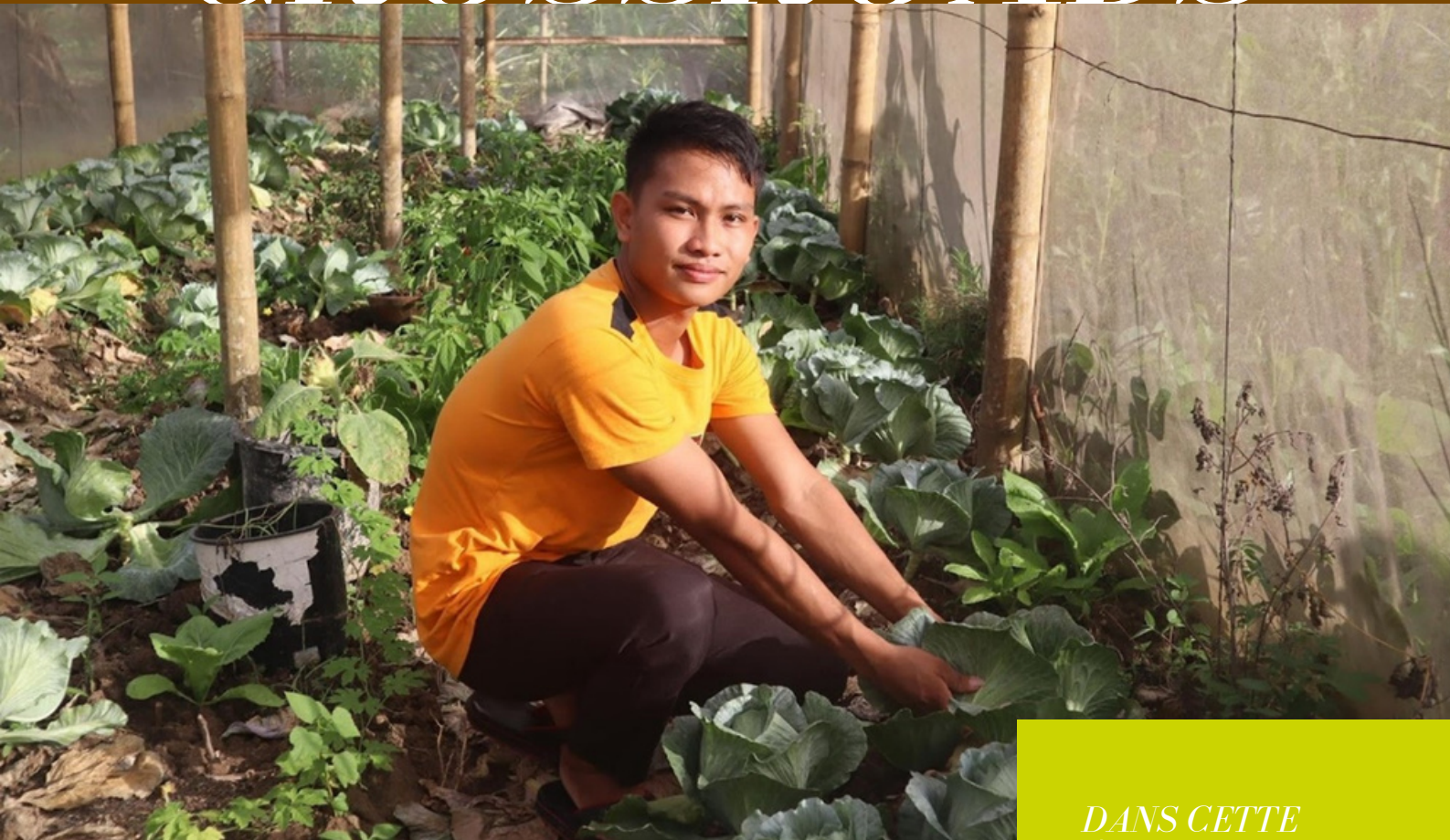
Jeune agriculteur aux Philippines